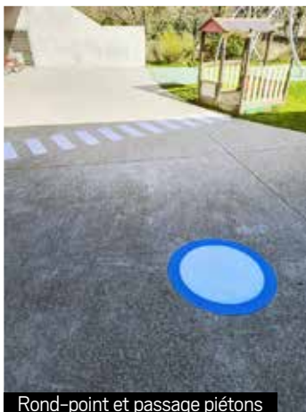
Rond-point et passage piétons