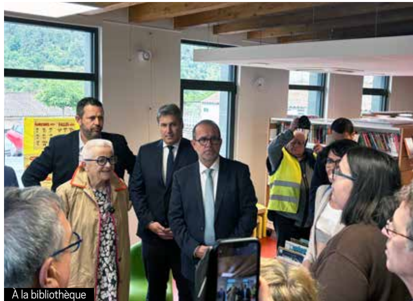
À la bibliothèque