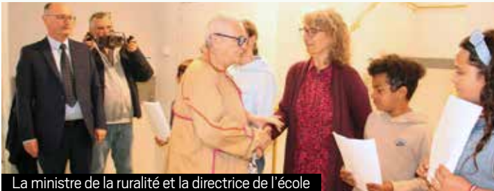
La ministre de la ruralité et la directrice de l'école