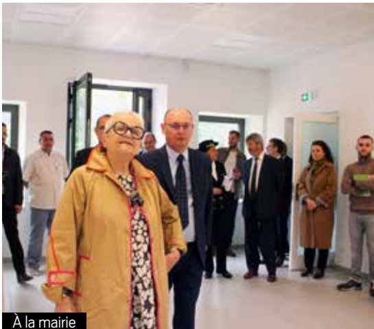
À la mairie