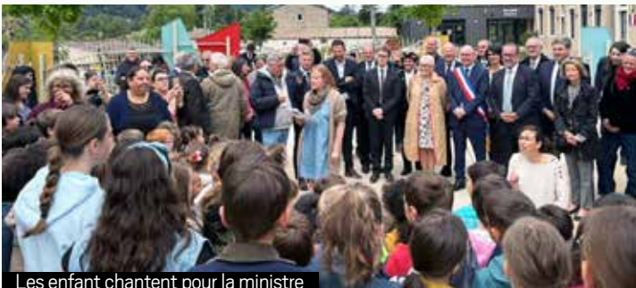
Les enfant chantent pour la ministre