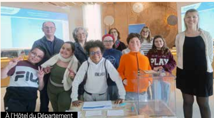
À l'Hôtel du Département

Grâce au soutien de la municipalité et du Département, cette visite s'est enrichie de découvertes culturelles : croisière sur la Seine et ascension de l'Arc de Triomphe. Entre histoire, institutions et patrimoine, cette journée a permis aux jeunes élus de mieux comprendre le fonctionnement de notre démocratie et de renforcer leur engagement citoyen.