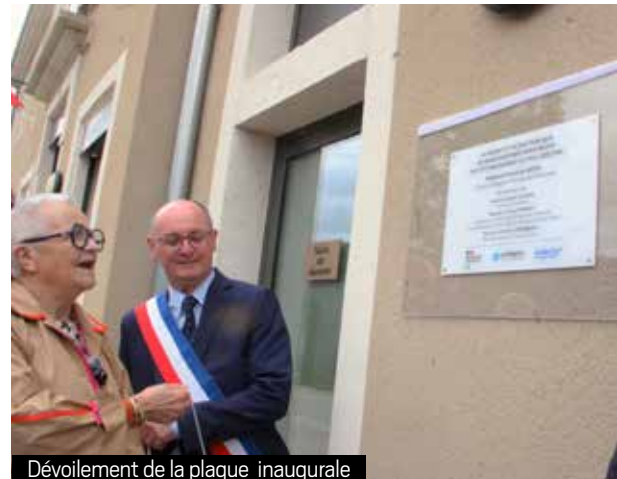
Dévoilement de la plaque inaugurale