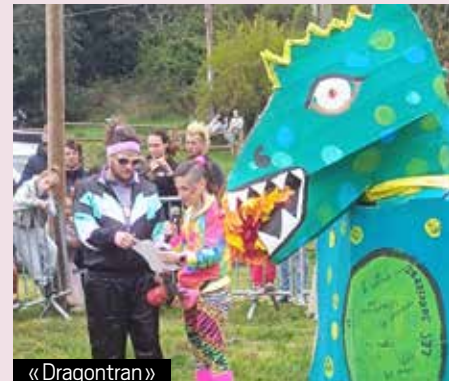
« Dragontran »