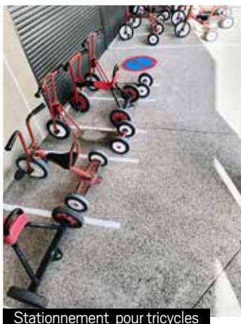
Stationnement pour tricycles