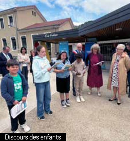
Discours des enfants