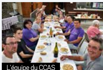
L'équipe du CCAS

Mercredi 25 juin, nos seniors ont visité la ville de Sète, ainsi qu'un mas conchylicole avec dégustation de différentes variétés d'huîtres. Une promenade en bateau a clôturé cette belle journée.