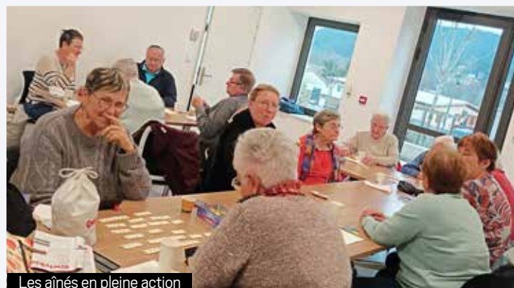
Les aînés en pleine action