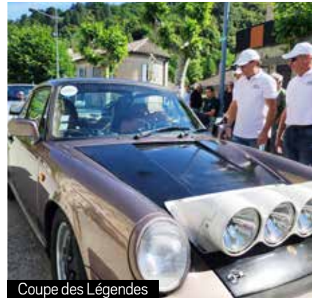
Coupe des Légendes

Mais au-delà de la mécanique, ce sont les équipages passionnés qui ont marqué les esprits. Venus de toute la région, ils ont partagé anecdotes, conseils et souvenirs dans une ambiance familiale et détendue, fidèle à l'esprit du terroir ardéchois.