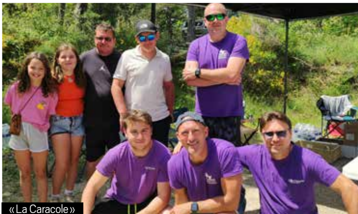
« La Caracole »

Pour la réussite de cette journée, les élus de la commission animation étaient soutenus par de nombreux bénévoles. Et tous affichaient leur satisfaction d'avoir pu faire découvrir leurs villages autrement, avec leurs secrets souvent insoupçonnés, et leurs magnifiques paysages empreints d'émerveillement. Le maire, présent parmi les bénévoles, les remercie chaleureusement pour