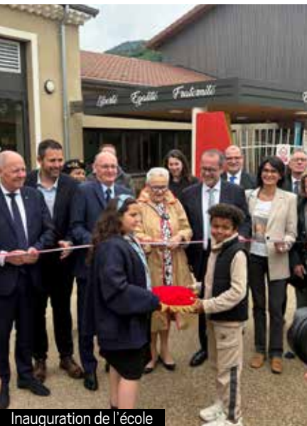
Inauguration de l'école