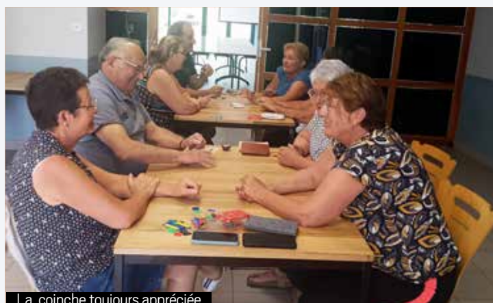
La coinche toujours appréciée