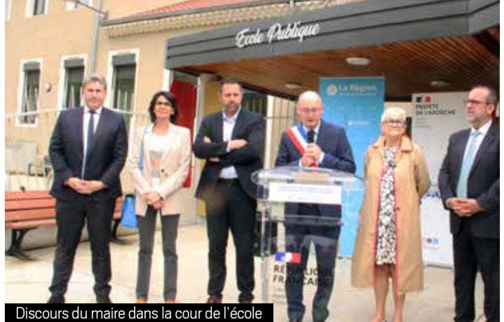
Discours du maire dans la cour de l'école