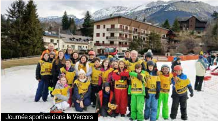
Journée sportive dans le Vercors