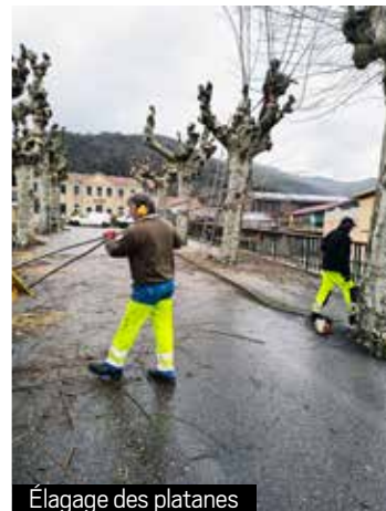
Élagage des platanes

Cette opération est nécessaire pour la préservation des arbres sur la commune.