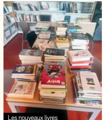
Les nouveaux livres