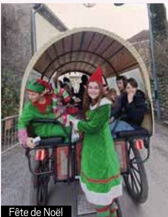
Fête de Noël