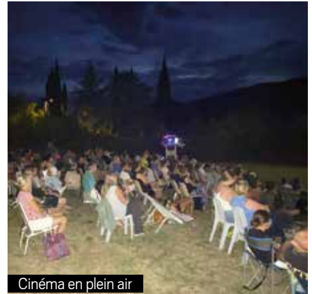
Cinéma en plein air

les émotions de ce film aussi tendre que drôle.