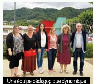
Une équipe pédagogique dynamique