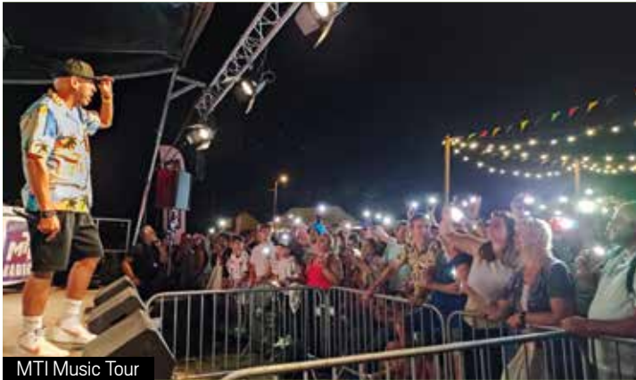
MTI Music Tour