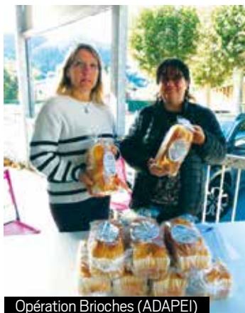
Opération Brioches (ADAPEI)