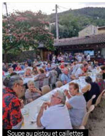
Soupe au pistou et caillettes