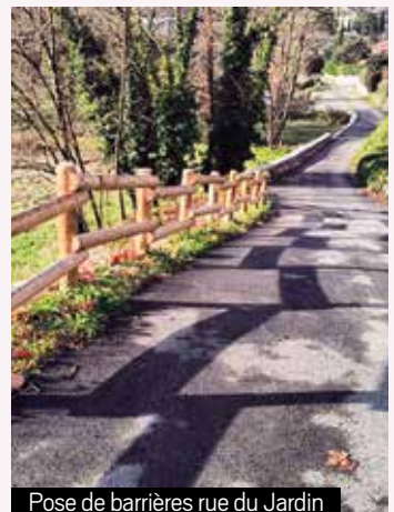
Pose de barrières rue du Jardin