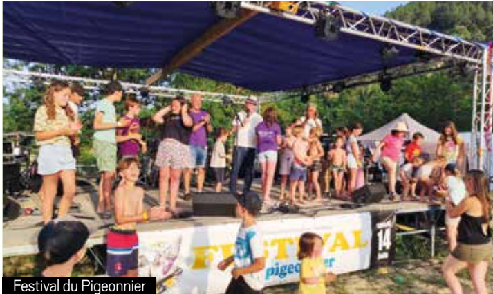
Festival du Pigeonnier