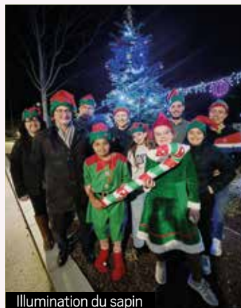
Illumination du sapin