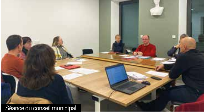
Séance du conseil municipal