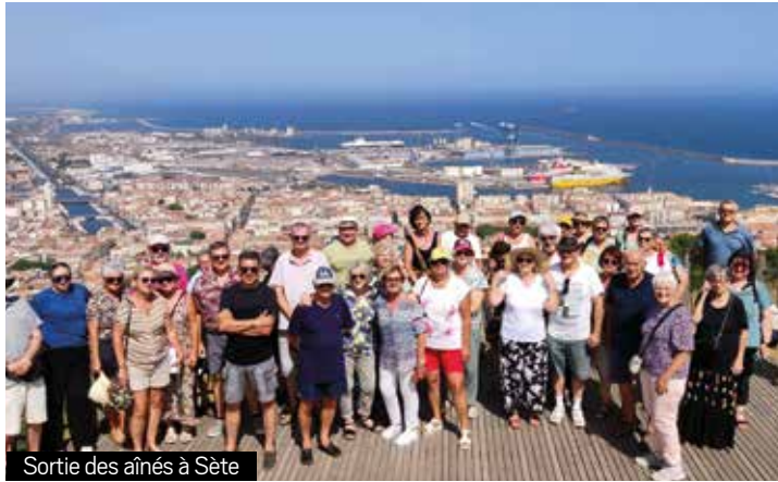
Sortie des aînés à Sète