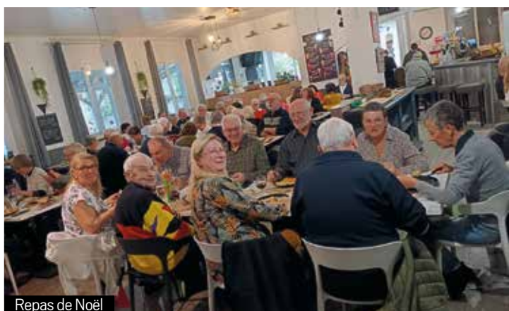
Repas de Noël