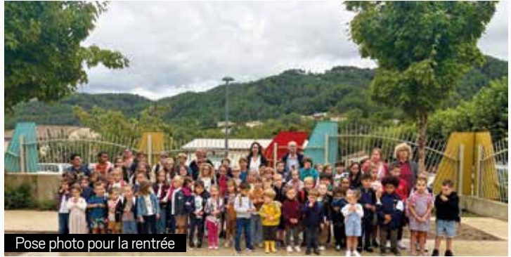
Pose photo pour la rentrée

Les parents, amis de l'école, ont assisté à un petit spectacle vendredi