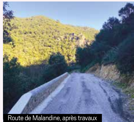
Route de Malandine, après travaux