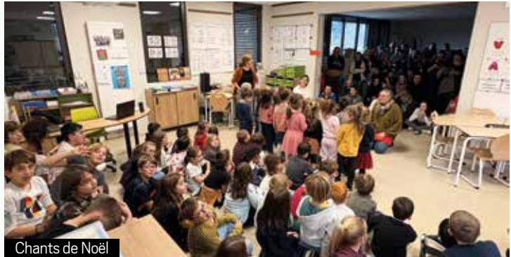
Chants de Noël

5 décembre, avec chants et goûter partagé.