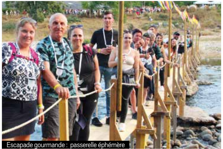
Escapade gourmande : passerelle éphémère

Les participants ont découvert autrement la Dolce Via et l'Eyrieux, grâce aux ponts éphémères sécurisés, avant de savourer une glace locale bio sur un fond musical à l'arrivée. La municipalité et les élus ont chaleureusement salué la réussite de cette soirée qui a combiné découverte du territoire, gastronomie et convivialité.