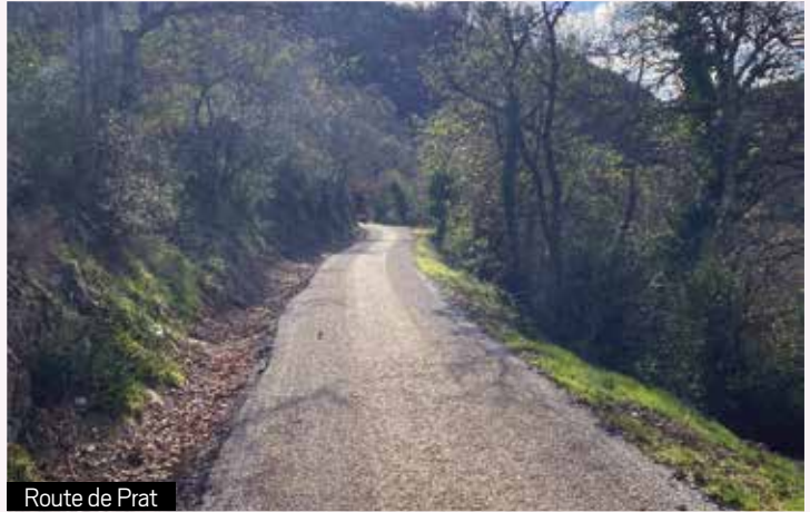
Route de Prat

À l'est du village, la rue du Jardin a gagné en sécurité grâce à la pose de nouvelles barrières tout au long de la montée jusqu'à la route départementale. Les agents du service technique ont installé ces équipements dans des fourreaux, permettant de les remplacer ou de les ajuster facilement en cas de besoin.