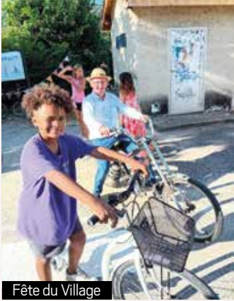
Fête du Village