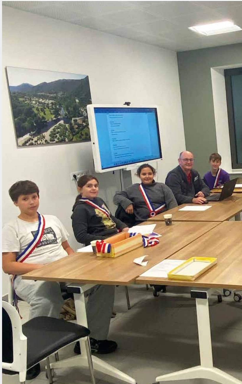
Conseil Municipal des Jeunes : l'avenir de Saint-Fortunat-sur-Eyrieux se construit aujourd'hui