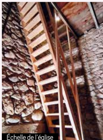
Échelle de l'église