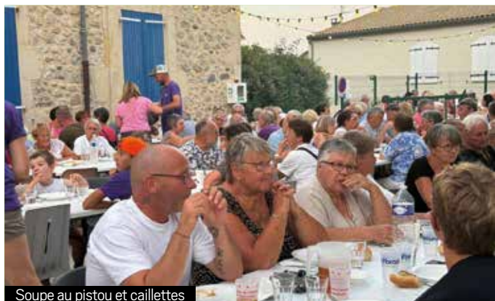
Soupe au pistou et caillettes