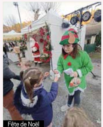
Fête de Noël