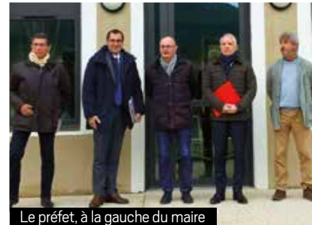
Le préfet, à la gauche du maire

Cette visite a enfin permis d'aborder d'autres thématiques essentielles : sécurité (avec le bilan positif de la vidéoprotection installée il y a trois ans), santé et accès aux soins, numérique et téléphonie, enseignement, ainsi que