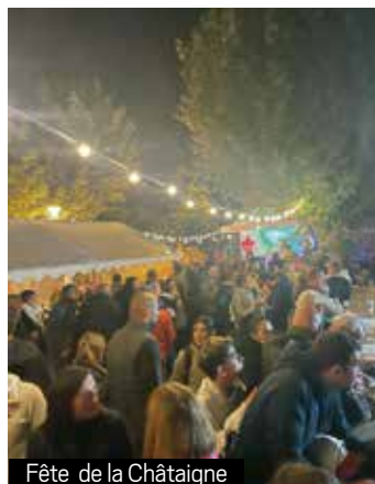
Fête de la Châtaigne