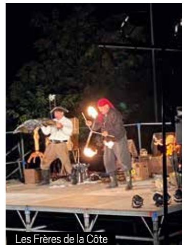
Les Frères de la Côte