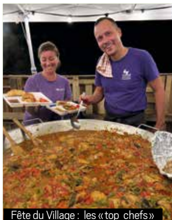
Fête du Village : les « top chefs »