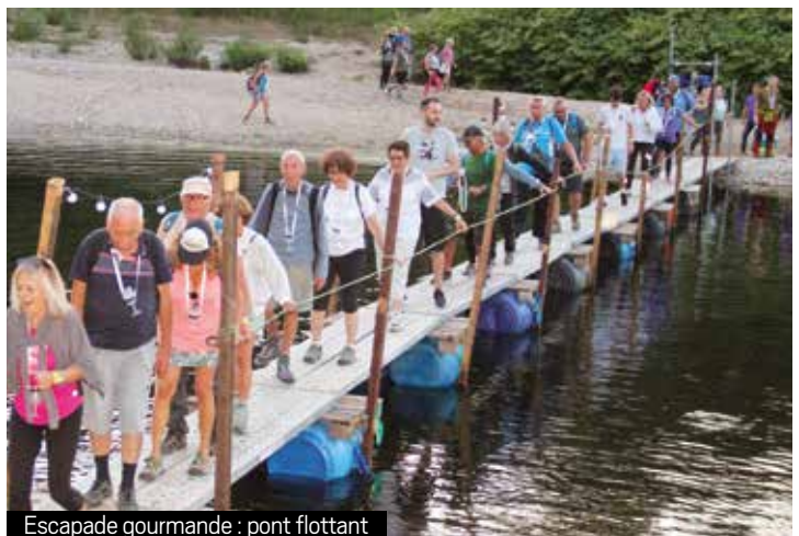
Escapade gourmande : pont flottant