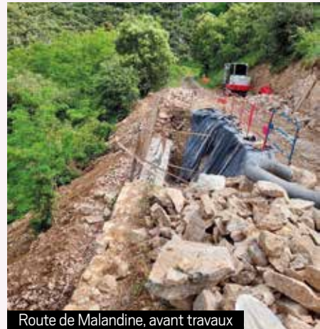
Route de Malandine, avant travaux