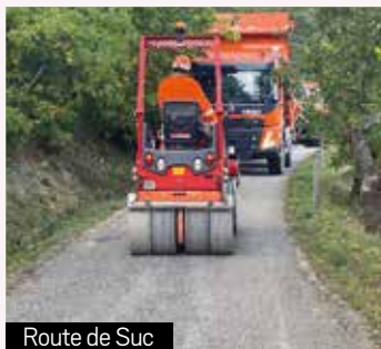
Route de Suc

Les travaux sur la route de Prat ont été réalisés par Les Goudronneurs Ardéchois, avec le concours de Bertrand TP pour les fossés.