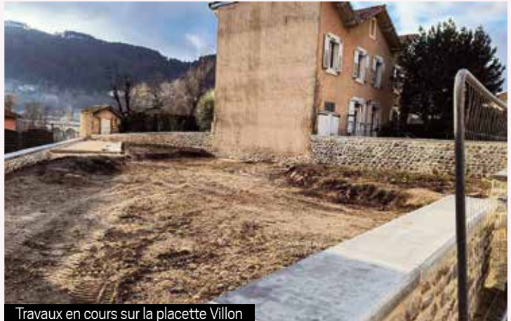
Travaux en cours sur la placette Villon