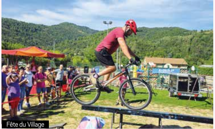
Fête du Village