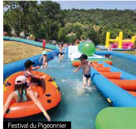
Festival du Pigeonnier

Cette année encore, Saint-Fortunat-sur-Eyrieux a vibré au rythme de ses animations estivales, festives et fédératrices, preuve que notre village est animé par l'énergie et l'implication de chacun.